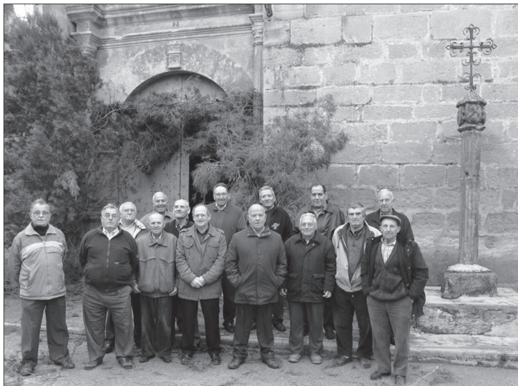
Despertadores de Torrecilla de Alcañiz (12.04.09)

cial al enramado de la fachada de la iglesia y otros edificios singulares. Los distintos puntos del recorrido urbano donde los despertadores paran a cantar cuentan con una placa que reza así "canto de los despertadores", siendo tras la iglesia los trece restantes, los siguientes: segundo, esquina calle San Roque y calle El Horno; tercero, esquina calle Horno y calle Portolés; cuarto, esquina calle Rebullida y calle Pardo Castrón; quinto, esquina calle Pardo Castrón y calle Patios; sexto, plaza de España; séptimo, esquina calle Mayor y calle Diputación; octavo, esquina calle Mayor y calle Foz; noveno, esquina calle Reja y calle Foz; décimo, calle San Miguel; décimo primero, plaza de Andrade; décimo segundo, esquina calle Ramón y Cajal y calle Subida de la Iglesia; décimo tercero, plaza de la Iglesia; y, décimo cuarto, puerta de la Iglesia. A continuación se entra en la iglesia donde da comienzo el Rosario de la Aurora, tras rezarse el primer misterio dentro se sale en procesión con el Rosario cantado volviendo a hacer el mismo recorrido que el de la despierta, se vuelve a la iglesia para finalizarlo y cantar las últimas coplas.