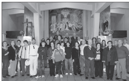
En el interior del santuario de Ntra a Sr a de Sameiro (03.05.09)

con ello se propicia el reencuentro de la familia más o menos dispersa de la Aurora recuperándola en aquellos lugares donde existe un grave peligro de desaparecer y evitando todo tipo de suspicacia y de enfrentamiento; y, por otro, como medio de dignificar la Aurora, "no convertirla en el canto de cuatro locos, sino en algo que es uno de los acervos culturales más importante."