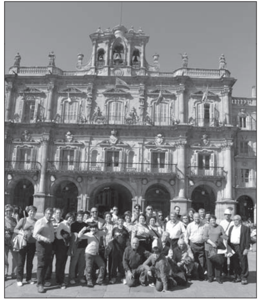
Ante el Ayuntamiento de Salamanca (04.05.09)