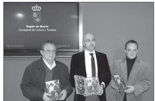
Presentación del disco libro Pasionaria murciana según los auroros (25.02.09)

El hecho de que se realcen estas publicaciones y de que nosotros desde la Consejería de Cultura y Turismo, desde la Dirección General de Promoción Cultural, apoyemos estas iniciativas evidentemente tiene una razón de ser, la de considerar importante: en primer lugar, potenciar el conocimiento de este tipo de fenómenos o formas musicales porque, probablemente, si desde las instituciones y desde el papel que juegan las Campanas Auroros con la actualización permanente de este tipo de músicas, éstas muy probablemente desaparecerían. Nosotros naturalmente estamos dispuestos y convencidos de que apoyar estas iniciativas es algo fundamental, para preservar no sólo el patrimonio inmaterial de la Región de Murcia, sino que también para preservar nuestra propia identidad cultural. Y el hecho de que se dediquen este tipo de estudios a estas formas musicales tiene una importancia fundamental ya que significa profundizar en ellas, descubrir su historia, descubrir sus relaciones en general con la música, descubrir sus relaciones con la propia sociedad en la que se han generado, y, sobre todo, difundir, hacer que estas formas musicales pasen a formar parte de la sociedad en la que en definitiva