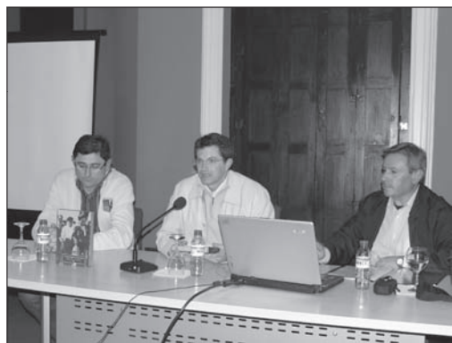
Presentación disco libro en Lorca (20.03.09)

ha hecho. Este es el principio de lo que tenemos que seguir trabajando. Aquí se abren muchas vías, muchos caminos, se habla de la música religiosa en unidad con la música del trovo, se habla de las tradiciones, se habla de cuando se empezó a ir a la iglesia de Nuestro Padre Jesús en San Andrés, el día de Jueves Santo, de las campanas que participan, de las cosas que se hacía, algo que se ha perdido y que con el tiempo se habrá de ir recuperando. Por tanto nos queda mucho trabajo por hacer, nos queda mucho por avanzar, pero con el ánimo y yo creo que después de haber pasado la crisis en los años sesenta, setenta y parte de los ochenta, y ahora ver el ánimo que ahora tenéis vosotros esto entre todos lo podemos hacer, lo podemos conseguir. Murcia tiene que seguir siendo Aurora y creo que con el paso del tiempo será mucho más Aurora que lo es ahora. Y ya para terminar, daros las gracias por estar aquí y lo de siempre que el farol os ilumine, que la campana os guíe y la Virgen de Rosario os acompañe. Gracias.