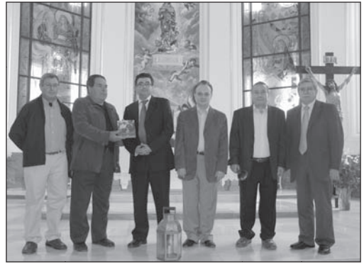
Presentación disco libro en Javalí Viejo (19.03.09)

Como novedades de mi trabajo destacaré al menos el hallazgo de determinadas fuentes musi-