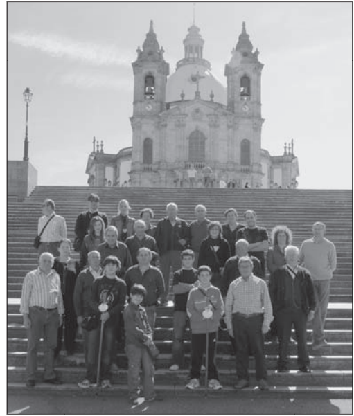
Ante el santuario de Ntra a Sr a de Sameiro (03.05.09)

Por último, quiero recordar que si este año con motivo del treinta aniversario de la Fiesta de las Cuadrillas de Barranda se edita un disco libro conmemorativo, que tuve el honor de coordinar, deciros que en 2009 sucede un tanto de lo mismo con los encuentros de cuadrillas de Lorca, en los que los despertadores de la Aurora lorquina participan, pienso que es un momento muy adecuado para pensar en editar un material parecido con el fin de homenajear a las actuales cuadrillas y las que en el transcurrir del tiempo desgraciadamente desaparecen.