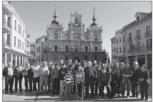
Ante el Ayuntamiento de Astorga (01.05.09)