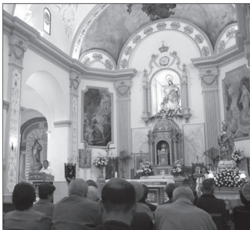
Presentación de disco en Javalí Nuevo (26.10.09)

El disco de Javalí Nuevo que hoy presentamos recoge una tradición de tiene cuatro siglos de antigüedad y que trajeron los dominicos a Javalí Nuevo al oficiar la fundación de la Hermandad de Ntra. Sra. del Rosario. En el seno de ella coexistían dos clases de hermanos: los de tarja que al no poder contribuir con dinero al sostenimiento de la hermandad aportaban su trabajo, la despierta. Al desaparecer los hermanos entarjados, son los auroros los depositarios de la tradición y los encargados de extender la devoción a Ntra. Sra. del Rosario. Pues bien, fieles a esa idea. el nuevo disco compacto reúne dividido en los distintos ciclos litúrgicos ordinario, navideño y de pasión, 22 salves del repertorio auroro, más un villancico no específico del mismo. Nace esta nueva obra con un triple objetivo: primero, difundir el canto de la Aurora que atesora la campana de