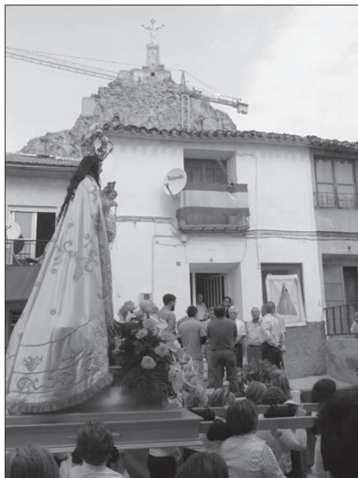
Homenaje a Virgen del Rosario en Monteagudo (12.10.09)

Nos esperaban los auroros de Santa Cruz en una de las calles del recorrido, y hemos vuelto a oír una preciosa oración cantada para Ella, para Ntra. Sra. del Rosario, que como yo no le veía la cara,