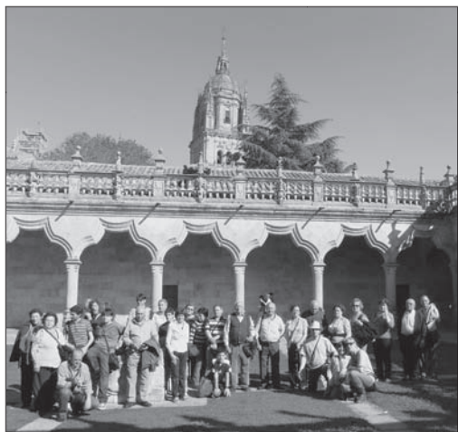
Al fondo la catedral de Salamanca (04.05.09)

cil dado que debemos encontrar un equilibrio entre los elementos objetivos conservados y los subjetivos propios de la misma expresión musical buscando, en algunos casos, las aproximaciones más verosímiles. Bajo la premisa de que en música no existe nunca una verdad absoluta, aun con el máximo respeto a las ideas que tuvieran los que en su día crearon estas músicas religiosas, y de su época, cada auroro aporta siempre su interpretación personal buscando intensificar el sentido trascendente de la música, de la misma forma que cada oyente percibe también esa misma música según el estado de ánimo del momento.