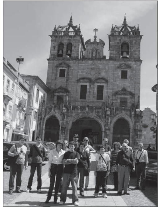
Ante la catedral de Braga (03.05.09)

Con el título que hemos elegido para este nuevo trabajo, "La pasionaria murciana según los auroros", hemos pretendido reivindicar la figura de Pedro Díaz Cassou y la de su obra, editada en 1897, con el título de "La pasionaria murciana", de obligada lectura para todo procesionista de la Semana Santa de la ciudad de Murcia.