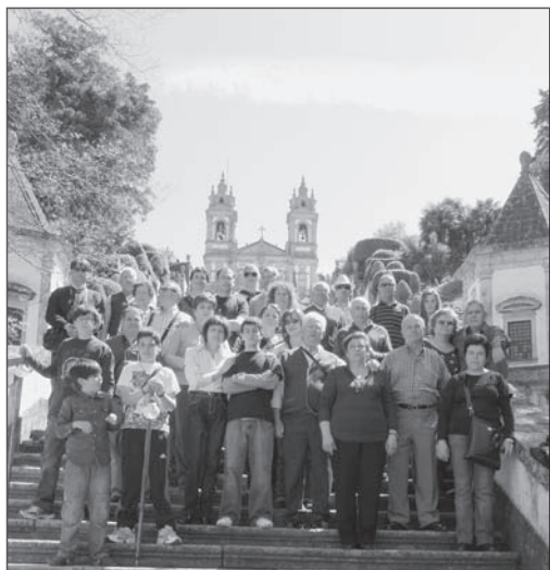
Ante el santuario de Buen Jesús del Monte (Braga, 03.05.09)