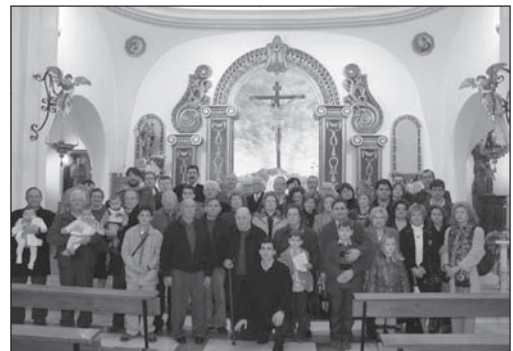
Con los auroros de Jacarilla en la iglesia parroquial (01.02.09)