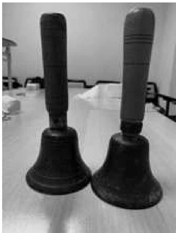
Figura 4. Campanillas de los auroros de Alhama de Murcia.

Los auroros de Alhama de Murcia poseen dos campanas de mano, hecho que junto a los auroros de Lorca y La Copa de Bullas los diferencian del resto de las hermandades de auroros de la Región de Murcia (López, 2019).