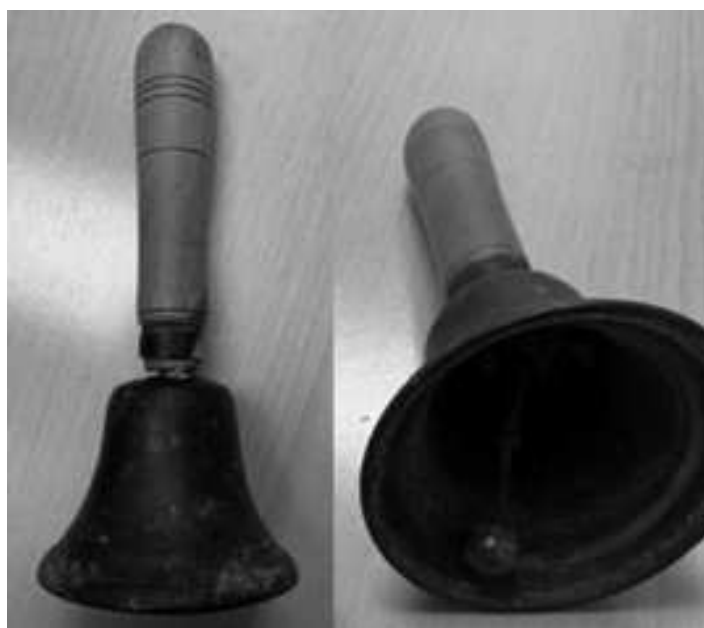
Figura 6. Campanilla grave de los auroros de Alhama de Murcia.

Respecto a su ejecución, las campanas se cogen con las manos por los mangos y posicionadas con el cuerpo de la campana hacia arriba. Se ejecutan moviendo al compás las muñecas y los brazos interpretando principalmente un ritmo binario. El toque para la Salve de Difuntos se ejecuta marcando con ambas campanillas a la vez la pulsación a ritmo de negras.