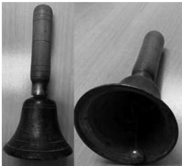
Figura 5. Campanilla aguda de los auroros de Alhama de Murcia.

En las Figuras 5 y 6 podemos apreciar dos perspectivas de las dos campanillas pertenecientes a los auroros de la Hermandad de la Aurora de Alhama de Murcia. Por un lado la vista frontal y por otra, el interior de la campana. También se puede apreciar el tipo de badajo, siendo éste de tipo esférico. Otro de los aspectos que se puede apreciar es el aspecto estético de instrumento. Sobre sus colores y matices se aprecian distintos tonos del color de la madera del mango y de la diversidad de aleaciones en el bronce de las partes metálicas. Entre las principales señas de desgaste, se encuentran las ocasionadas en el interior del cuerpo de la campana provocada por el entrechoque del badajo sobre ella.