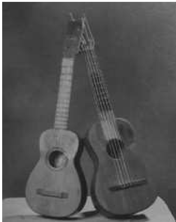
Figura 2. Guitarras de los auroros de Alhama. Fuente: Andreo (1996, 92)

formado por dos requintos (Figura 2), guitarra, dos campanillas y pandereta (solo en Navidad).