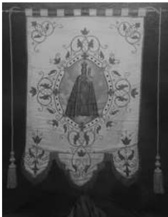
Figura 1. Estandarte de la Virgen.

En 1930 la Hermandad de la Aurora de Alhama adquirió dos faroles para llevarlos junto al estandarte de la Virgen (Figura 1) en sus salidas para cantar los días de Pascua por las calles (Baños, 2008).