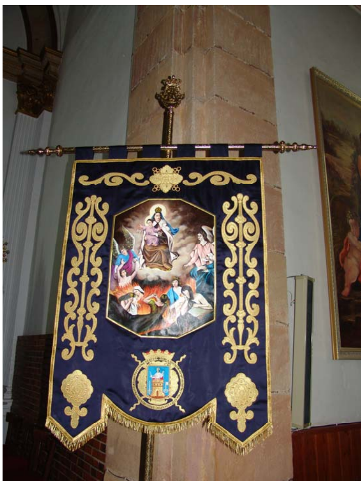
Nuevo estandarte de los auroros