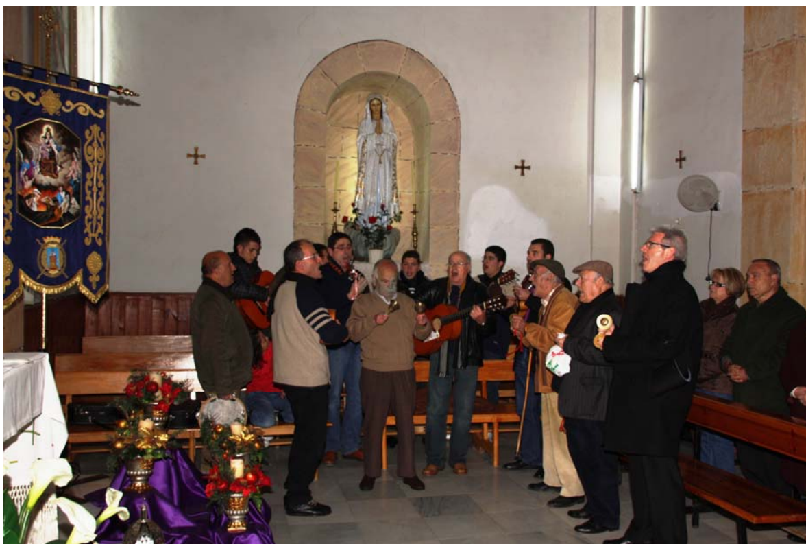
Los auroros de Lorca